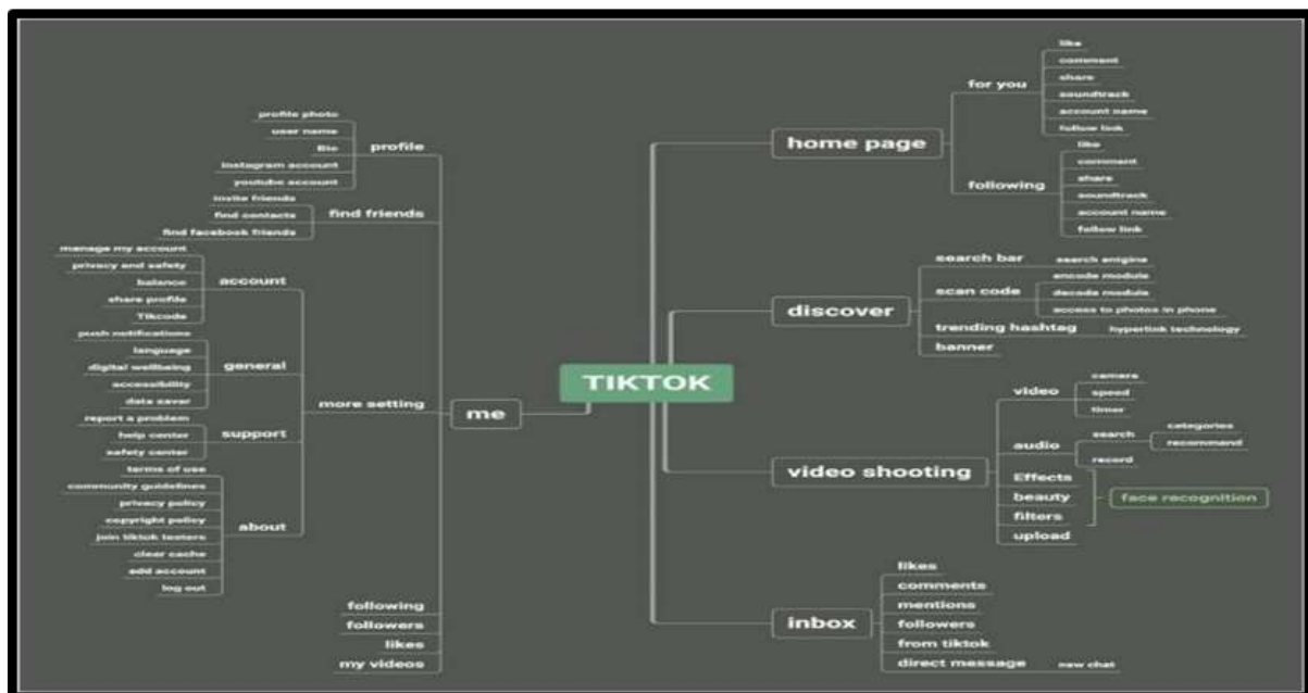
Rajah 2: Design Principles dalam perisian Tik Tok

Pada masa kini, platform popular seperti Facebook, Twitter, Whatsapp, Instagram, TikTok , dan lain-lain adalah media utama media sosial yang sering digunakan oleh masyarakat. Metodologi kajian ini adalah menggunakan kajian kepustakaan bagi mendapatkan sorotan ke atas bahan-bahan literatur seperti buku-buku ilmiah, jurnal, artikel seminar dan laporan. Seterusnya melalui kaedah ini pengkaji mendapat gambaran yang jelas mengenai prinsip, konsep, kaedah, pengolahan dan penganalisan data yang bersesuaian dengan reka bentuk kajian ini. Kajian ini memfokuskan kepada sisi negatif pengaruh aplikasi TikTok dalam mencorak pembangunan nilai seseorang individu