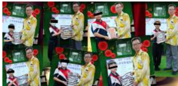
Rajah 10: Majlis Penyampaian Hadiah Bagi Murid Yang Mencapai Sasaran

Selepas intervensi, bilangan cap murid-murid telah dikira. Seperti yang diilustrasikan dalam Rajah 10, ganjaran dan pengiktirafan telah diberikan kepada murid-murid yang mencapai sasaran perekodan bacaan buku yang telah ditetapkan.