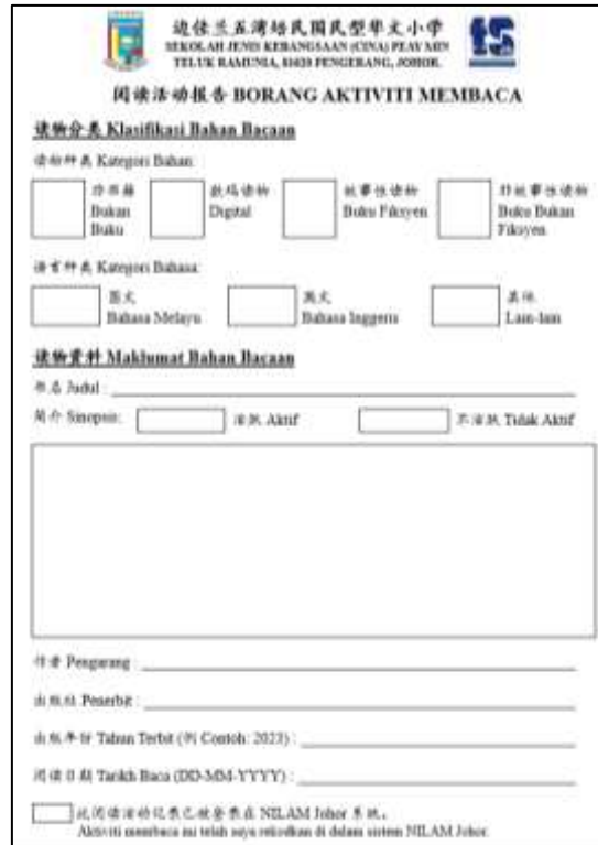
Rajah 3: Borang Pererekodan Bacaan NILAM Yang Telah Diadaptasi