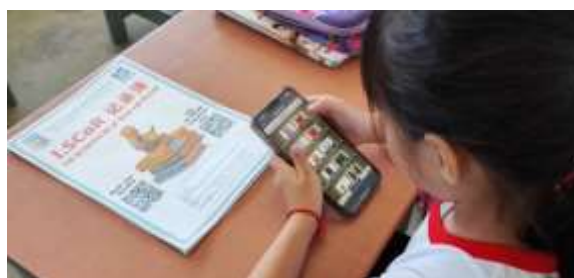
Rajah 6: Murid Melayari Perpustakaan Maya Sekolah

Aktiviti ini melibatkan murid mengimbas kod QR yang disediakan untuk mengakses perpustakaan maya sekolah yang menyimpan pelbagai bahan bacaan digital kepada murid. Murid-murid diberi peluang untuk memilih dan membaca buku-buku digital dalam talian.