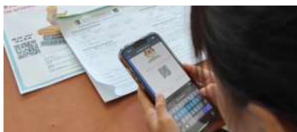
Rajah 8: Murid Mengakses Sistem NILAM Johor Selepas Mengimbas Kod QR

Aktiviti ini melibatkan perekodan bacaan buku dalam talian menggunakan sistem NILAM Johor selepas mengimbas kod QR yang disediakan. Murid-murid log masuk dengan akaun emel DELIMa ( Digital Education Learning Initiative Malaysia ) mereka lalu merekodkan bacaan buku mereka di sistem tersebut.