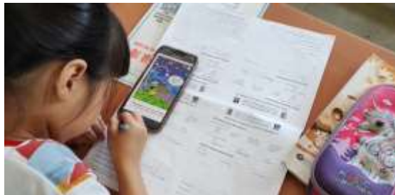
Rajah 7: Murid Merekodkan Bacaan Buku Dengan Borang Yang Diperbaharui

Dalam aktiviti ini, murid menggunakan borang rekod yang telah diperbaharui untuk merekodkan bacaan buku seperti yang ditunjukkan dalam Rajah 7.