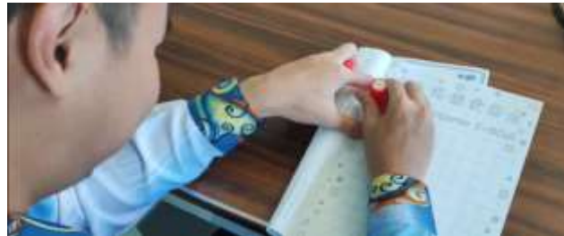
Rajah 9: Guru Menyemak Rekod Bacaan Murid Lalu Memberi Cap Pada Borang Catatan Token

Aktiviti ini melibatkan dua fasa iaitu pemberian cap bagi setiap rekod bacaan buku yang disiapkan seperti yang ditunjukkan di Rajah 9.