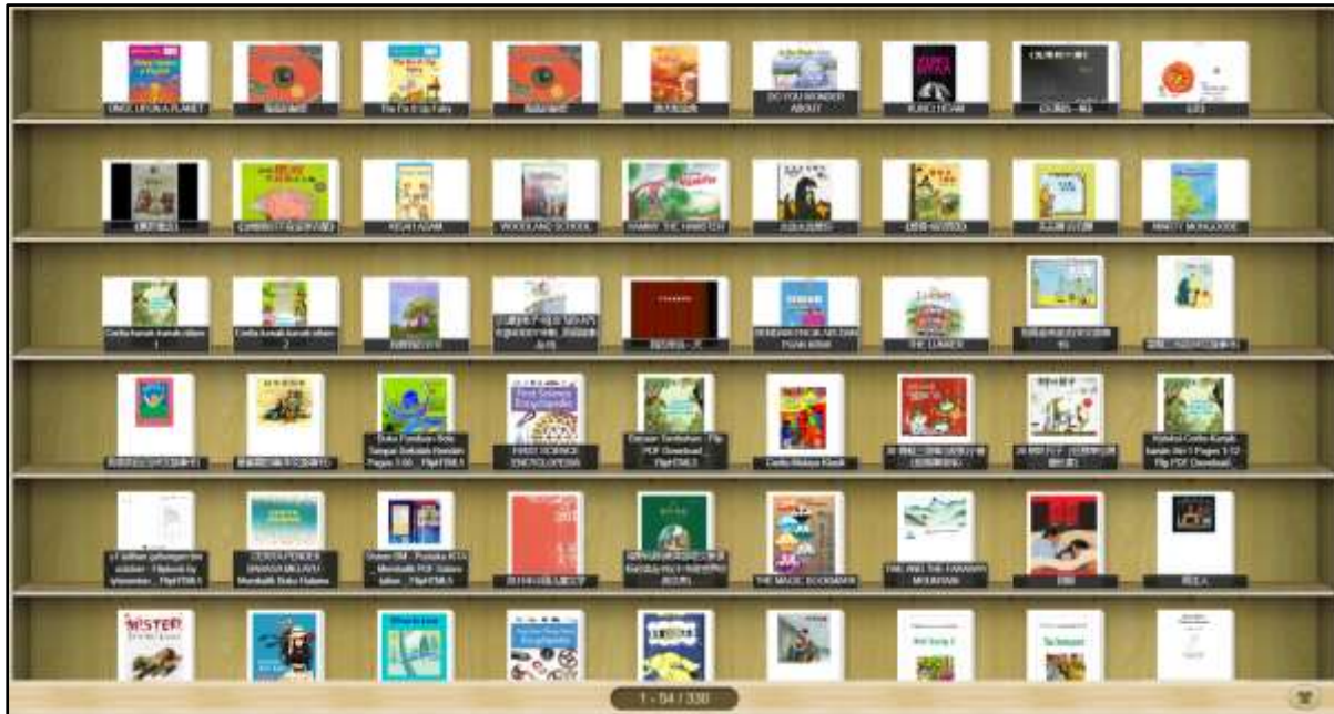
Rajah 5: Paparan Utama Perpustakaan Maya