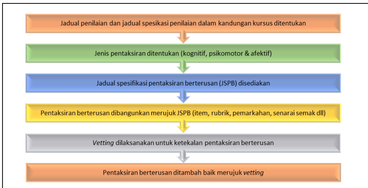
Rajah 1: Proses Pembangunan Pentaksiran Berterusan

Elemen pentaksiran berterusan terkandung dalam pembelajaran berasaskan hasil dan penjajaran konstruktif. Pentaksiran berterusan bertujuan untuk mengukur pencapaian dan prestasi murid mengikut hasil pembelajaran kursus yang ditetapkan dalam silibus serta kandungan kursus. Pentaksiran berterusan dalam pendidikan vokasional dibangunkan merujuk Jadual Spesifikasi Pentaksiran Berterusan (JSPB). JSPB adalah jadual yang menetapkan komponen penilaian, kaedah pentaksiran, domain dan pemberat merujuk jadual penilaian dan jadual spesifikasi penilaian dalam kandungan kursus. Rajah 1 menunjukkan proses pembangunan pentaksiran berterusan yang biasa dilaksanakan dalam pendidikan vokasional.